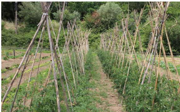
Figura 4: Huerto de cultivo ecológico en la RB