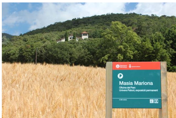
Figura 2: Masía Mariona, sede de la RB y del parque

El clima de confianza y colaboración generado era el mejor mecanismo de comunicación con que contaban los gestores a la hora de comunicar la propuesta de nuevos límites para la RB. Sobre esa base, el período de comunicación, discusión y establecimiento de consensos y compromisos fue laborioso porque suponía interacción con un número de personas muy elevado, pero resultó eficaz.