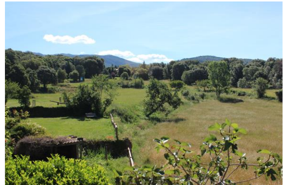
Figura 3: Mosaico de bosque y prados

bien los agentes locales y el equipo técnico. La toma de postura de los agentes locales resultó el argumento más convincente para cambiar las posturas iniciales y contribuir en la generación de estructuras administrativas de gobernanza participativa (objetivo 17).