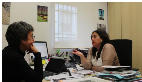
Figura 5. La gestora de la RB Alto Bernesga explica su experiencia

Por otra parte, la dimensión ambiental en la experiencia del trabajo con las mujeres se ha introducido de manera transversal, y, como se recoge en las aportaciones de las emprendedoras, se ha interiorizado formando parte de la calidad de la marca RB.