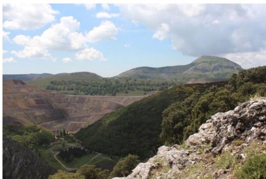
Figura 3. Mina a cielo abierto, de carbón en la RB Alto Bernesga

La crisis provocada por el cierre de la minería a partir de 1991. Uno de los efectos inmediatos era la despoblación del territorio y, con ello, el abandono de muchas actividades, la pérdida de servicios, la disminución de presupuestos públicos, la frustración colectiva. De 14.000 habitantes en la comarca 25 años atrás se pasó a 4.500 en 2016.