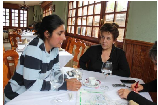
Figura 4. Emprendedoras de la RB Alto Bernesga