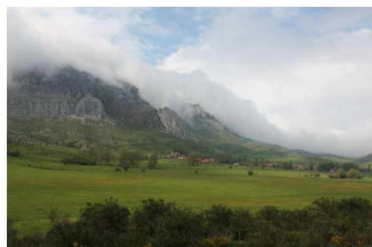
Figura 2. Pastos de montaña en la RB Alto Bernesga

La actividad económica, que antes fue tradicionalmente ganadera, fue sustituida a lo largo del siglo XX por la minería de carbón. En los últimos años se han cerrado las minas provocando a escala local una crisis integral (social, económica, ambiental, demográfica...), punto de partida de la experiencia de desarrollo sostenible que se presenta en este caso de estudio.